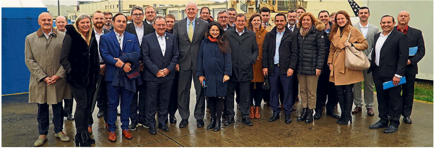
Eng parlamentaresch Delegatioun huet d'Gebaihechkeete vun der WSA zu Suessem besicht.

Déi illegitim Aggressioun vu Russland géint d'Ukrain huet d'Noutwendegkeet bewisen, d'Zesummenaarbecht tëscht den NATO-Alliiéierte weider ze verdéiwen an dat aktuell strateegesch Konzept vun der Militäralianz unzepassen, fir déi nei Erausforderungen ze reflektieren.