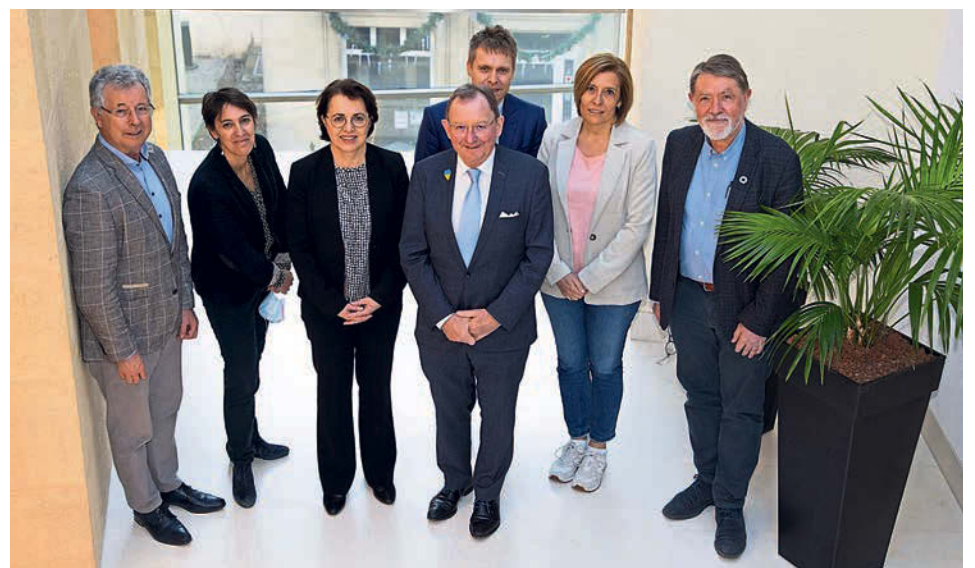
La délégation luxembourgeoise du CPI a rencontré Mme Claire Lignières-Counathe, Ambassadrice de France (3 e de gauche).

Quant à la présidence française du Conseil de l'Union européenne, placée sous le mot d'ordre « relance, puissance, appartenance », les discussions ont notamment porté sur l'échéance du 9 mai 2022, date prévue pour la clôture de la phase de consultation de la Conférence sur l'avenir de l'Europe. Les propositions des citoyens, des parlements nationaux et aussi du CPI qui a émis une contribution afférente seront reprises de façon hiérarchisée dans un rapport de la présidence. Ceci sera probablement le début d'une nouvelle phase, menant éventuellement à un changement de traités européens. D'autres priorités de la présidence française sont l'État de droit, le numérique, la transition écologique, l'Année européenne de la jeunesse, les programmes de recherche et les questions énergétiques.