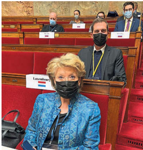
M. Yves Cruchten, Président de la délégation luxembourgeoise, et Mme Viviane Reding, membre, ont représenté la Chambre à Paris.

La signature d'une déclaration commune des chefs de délégation des pays membres de la COSAC (Conférence des organes spécialisés dans les affaires communautaires) en soutien à l'Ukraine agressive par la Fédération de Russie a été le point culminant de l'Assemblée plénière les 4 et 5 mars 2022 à Paris.