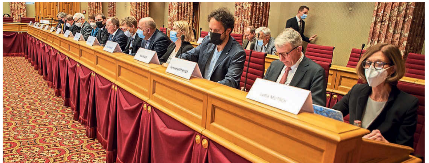
Le Commissaire européen à la rencontre des députés et eurodéputés luxembourgeois

20 e Conférence interparlementaire sur la PESC et la PSDC