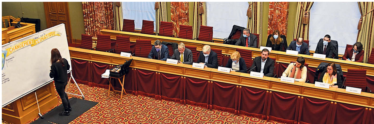
Les membres de la sous-commission « Avenir de l'Europe » ont discuté avec des représentants de la société civile sur le changement climatique.

L'Administration parlementaire recrute :