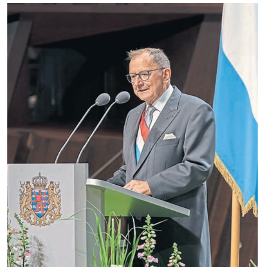
De Chamberspresident, den Här Fernand Etgen, während senger Ried an der Philharmonie

Fir de Chamberspresident sollt Nationalfeierdag 2022 ënnert dem Zeeche vun der Solidaritéit stoen. Dës Solidaritéit sollt sech an ënnerschiddleche Forme weisen: mat der Ukrain, am Kontext vun de sozialen an ekonomeschen Ongläichheete vun der sanitärer Kris, awer och beim Klimawandel.