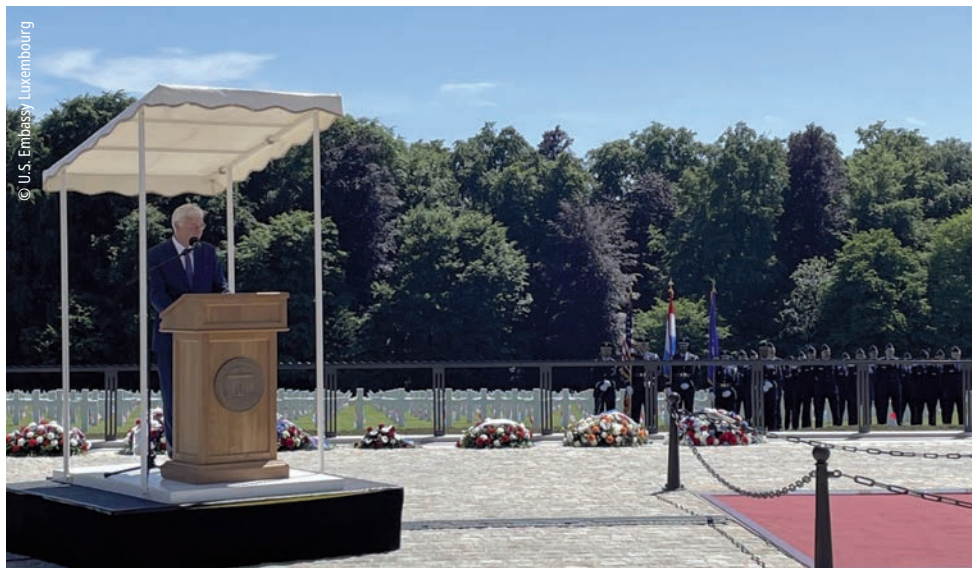
Le Président de la Chambre a rendu hommage aux soldats américains décédés dans l'exercice de leurs fonctions.

Aux États-Unis, le « Memorial Day » rend hommage aux femmes et aux hommes décédés dans l'exercice de leurs fonctions au sein de l'armée américaine. Tous les ans, ce jour se célèbre le dernier lundi de mai.