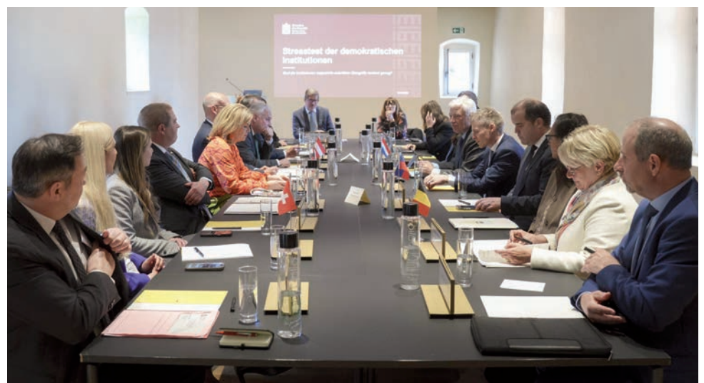
La première partie du « Stress test des institutions démocratiques du Luxembourg » a été présentée aux Présidents des Parlements germanophones réunis au Luxembourg.

La deuxième partie du Stress test, attendue d'ici fin de l'année, portera sur la solidité de l'équilibre