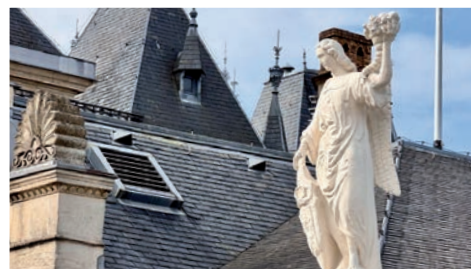
La figure au coin de la rue de l'Eau porte une corne d'abondance et un bouclier affichant un blason luxembourgeois. Il s'agit d'attributs qui suggèrent la fécondité et la prospérité nationale.