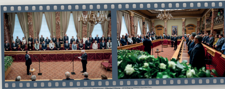
Chamber vun den Deputéierten – Effentlech Sitzung – Vereedegung | Functioel Foto

„Haut ass en Dag, wou Lëtzeburger Geschicht geschriwwé gëtt. [...] D'Traditioun leeft also weider, mee haut ass et déi éischte Kéier, datt e Grand-Duc Héritier den Eed virun der ganzer Chamber an enger effentlecher Sëtzung ofleet. Dat wollt d'Parlament esou, well dëse Moment symbolesch an demokratesch weesentlech ass. Är zukünfteg Fonctioun kritt doduerch och déi néideg Legitimitéit.“