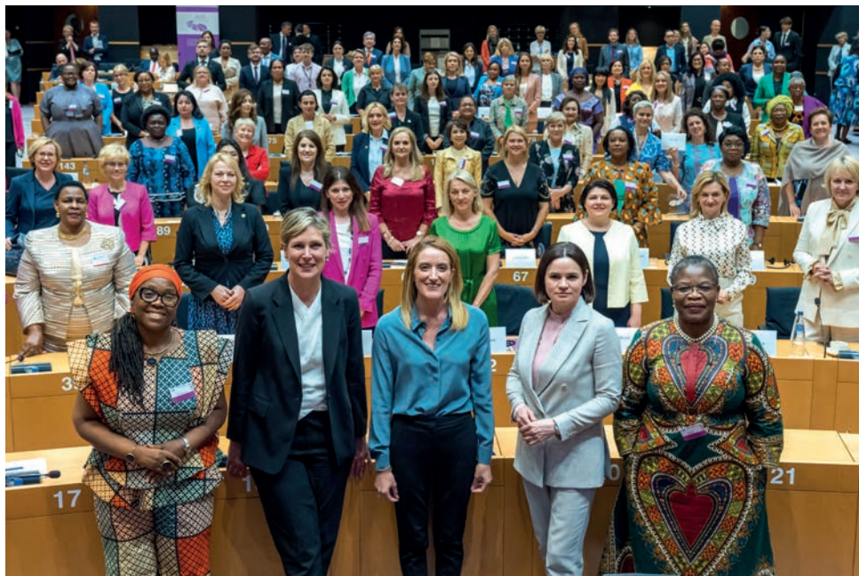
Mme Djuna Bernard (3 e rangée, 3 e à droite) a participé au 10 e sommet des femmes dirigeantes politiques.

Women Political Leaders (WPL) – femmes dirigeantes politiques – est un réseau global de femmes politiques qui vise à renforcer la représentation et le rôle de la femme dans le monde politique. À cet effet, ses membres se réunissent plusieurs fois par an afin de promouvoir la place des femmes au sein du monde politique. Le 10 e sommet de WPL s'est déroulé les 7 et 8 juin 2023 à Bruxelles et s'est concentré sur l'importance de la représentation féminine.