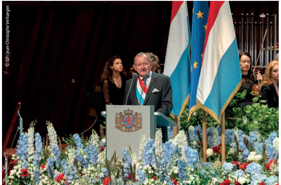
„Mir réckelen hei am Land zesammen, wann et drop ukënn, a mir wuessen doduerch“, huet de Chamberpresident während senger Ried an der Philharmonie ënnerstrach.

Dat schéngt de Lëtzebuerger ze hëllefen, eng Gesellschaft an e Land virunzedeiwen, déi ëmmer um