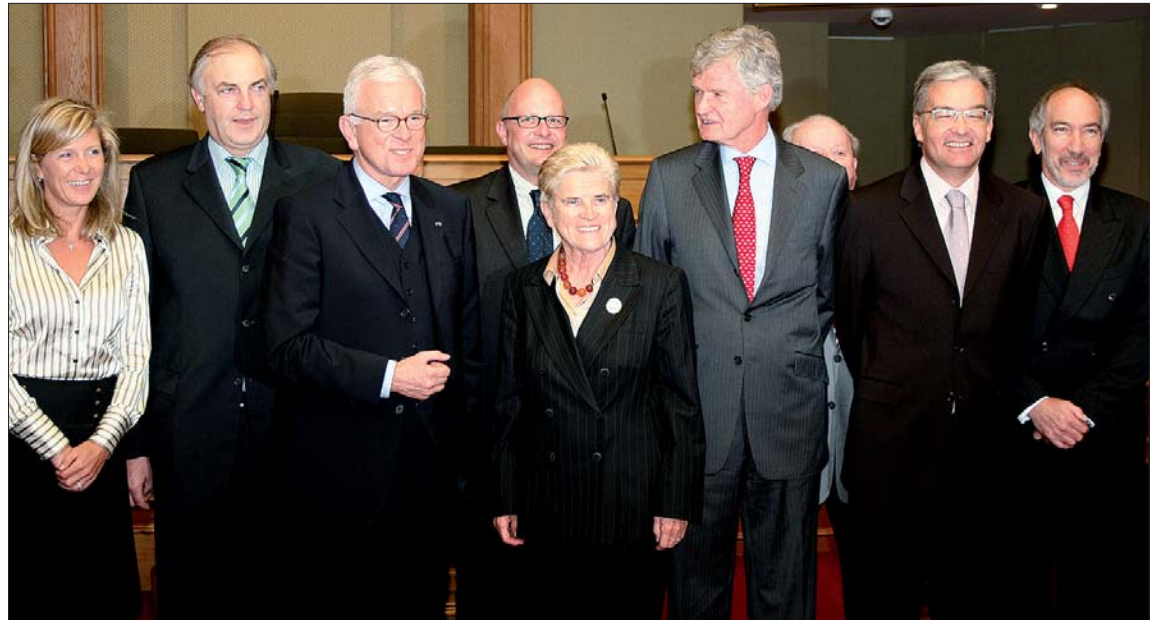
Schwerpunkt der Unterredung mit luxemburgischen Abgeordneten war die Zukunft des Verfassungsvertrages

angemessen vertreten sein müssen“, einen definitiven Text beschließen, der dann in den Mitgliedsländern ratifiziert werden müsse. „Mein Wunsch wäre es, dass dieser gesamte Prozess noch vor den Europawahlen im Juni 2009 abgeschlossen werden kann.“ Zu diesem Zeitpunkt wird die Amtszeit des neuen Parlamentspräsidenten zu Ende gehen.