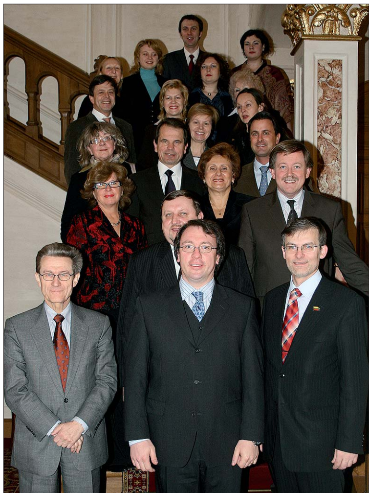
Les délégations lituanienne et luxembourgeoise

La Lituanie est depuis 2004 membre de l'Union européenne, sa déclaration d'indépendance date de 1991 et sa Constitution de 1992. Après ce parcours court mais intense, les députés lituaniens sont intéressés aux systèmes politiques des autres pays, donc aussi du Luxembourg.