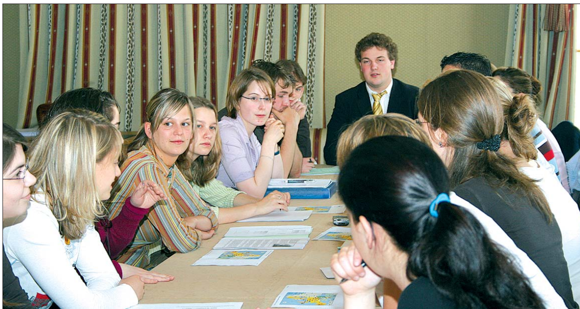
Travail en groupes sur des sujets européens

Le 6 mai 2006, un Parlement des jeunes a rassemblé des élèves des classes supérieures des différents établissements de l'enseignement secondaire dans la salle plénière