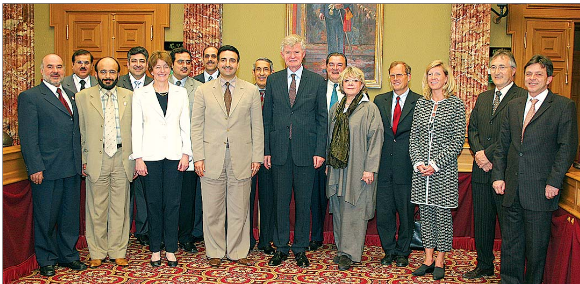
La délégation de l'Assemblée nationale du Koweït a rencontré les membres de la Commission des Affaires étrangères et européennes, de la Défense, de la Coopération et de l'Immigration

Une délégation du groupe d'amitié interparlementaire Koweït-Luxembourg du Majles Al-Umah (Assemblée nationale) de l'État du Koweït était en visite officielle à Luxembourg du 25 au 28 avril 2006.