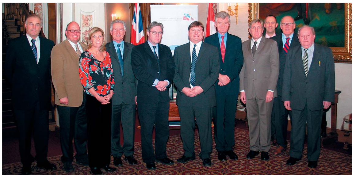
Les délégations parlementaires anglaise et luxembourgeoise.