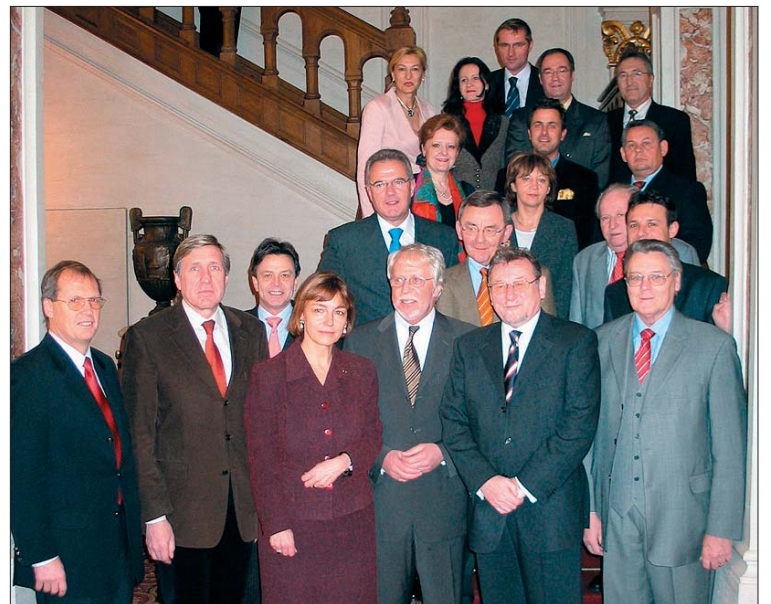
Les délégations parlementaires croate et luxembourgeoise

seule question ouverte serait celle du général Gotovina. Toute la délégation a affirmé que les autorités croates n'avaient aucune indi-