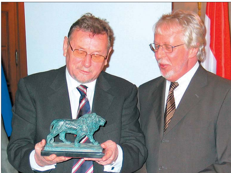
M. Vladimir Seks et M. Lucien Weiler

Au cours d'une conférence de presse à la Chambre des Députés, suite aux entretiens avec une délégation parlementaire luxembourgeoise, le Président Vladimir Seks s'est dit surpris par la déclaration du commissaire Rehn. «Mon pays a répondu à 489 des 490 demandes concrètes formulées par le TPIY», a-t-il dit. La