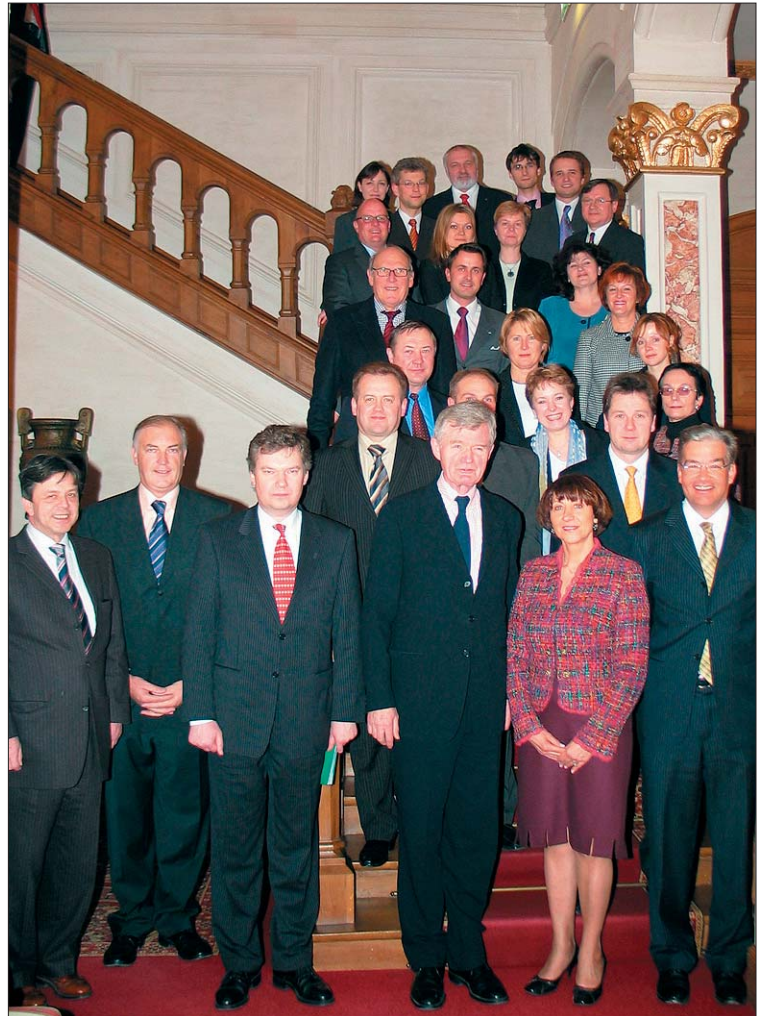
Les délégations parlementaires lituanienne et luxembourgeoise.

L'entrevue précédente (avec la délégation de la République de Lituanie) avait porté avant tout sur la révision de la stratégie de Lisbonne. Les parlementaires lituaniens se sont intéressés à la démarche luxembourgeoise concernant la redéfinition des ambitions et la mise en place d'un plan national.