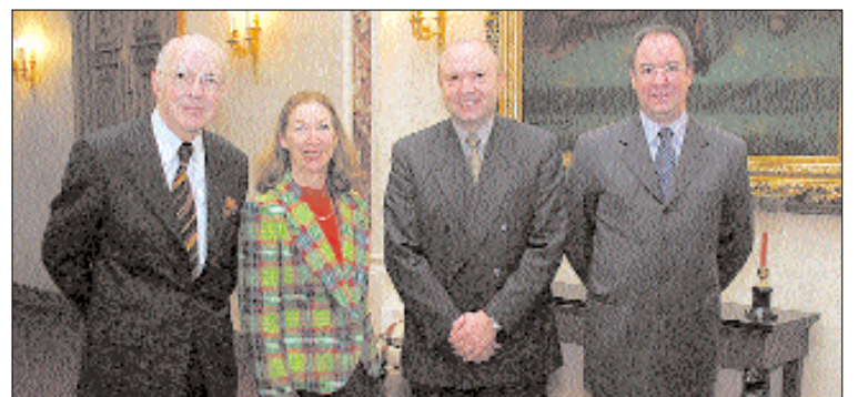
Les deux ambassadeurs entourés du Président et du Secrétaire général de la Chambre des Députés

Le Président de la Chambre des Députés est en contact régulier avec les membres du corps diplomatique accrédités au Luxembourg. Ainsi, au cours de la matinée du 14 février, il a reçu les ambassadeurs de la Confédération Suisse et de la République Tchèque à l'Hôtel de la Chambre des Députés. L'ambassadeur suis-