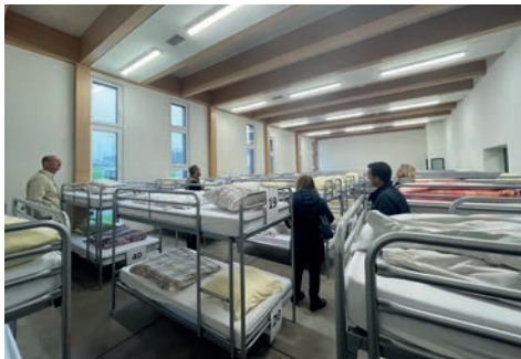
Les députés membres de la Commission de la Famille et de l'Intégration se sont rendu compte de l'étendue des installations de la « Wanteraktioun »

À la veille de l'ouverture officielle de la « Wanteraktioun » de cet hiver, les députés membres de la Commission de la Famille et de l'Intégration, de concert avec la Ministre de la Famille, de l'Intégration et à la Grande Région, Mme Corinne Cahen, ont visité les locaux situés près de l'Aéroport de Findel afin de mieux cerner les enjeux qui sous-tendent cette initiative.