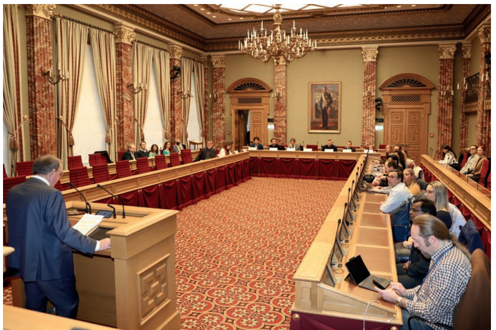
Le Président de la Chambre des Députés, M. Fernand Etgen, lors de son allocution de bienvenue

La Cellule scientifique de la Chambre des Députés est chargée d'encadrer le Pairing scheme. Créée en sep-