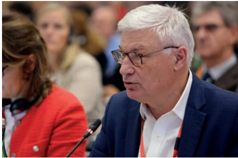
M. Claude Wiseler lors de son intervention

M. Claude Wiseler, en sa qualité de Vice-Président de la Commission des Affaires étrangères et européennes, de la Coopération, de l'Immigration et de l'Asile, a participé à la session plénière de la Conférence des organes spécialisés dans les affaires communautaires (COSAC) qui s'est tenue à Prague du 13 au 15 novembre 2022.