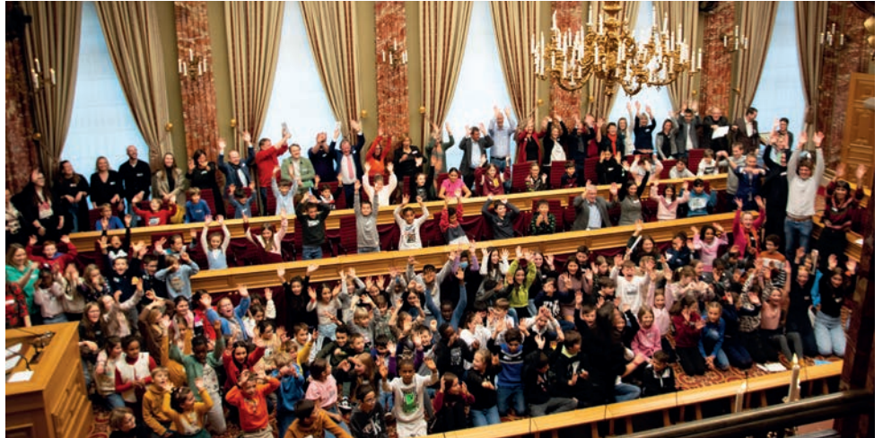
Tous les participants se sont rassemblés dans la salle plénière pour écouter les déclarations des élèves.

Les jeunes participants, âgés entre 8 et 12 ans, se sont déplacés en train ou en bus pour partager leurs idées relatives aux besoins et aux droits de l'enfant avec les parlementaires. Dix ateliers de discussion ont été organisés sous l'égide de la Chambre et chaque atelier a été rejoint par un ou deux députés.