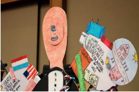
Les élèves avaient préparé en amont des figures colorées en carton qui résument leurs revendications.

Les élèves ont élaboré des déclarations présentées ensuite en plénière, en présence des députés. À la base de ces déclarations figuraient des sujets leur tenant particulièrement à cœur et qu'ils avaient préparés en amont avec leurs classes. À cette fin, ils ont amené des figurines colorées en carton qui résument leurs revendications.