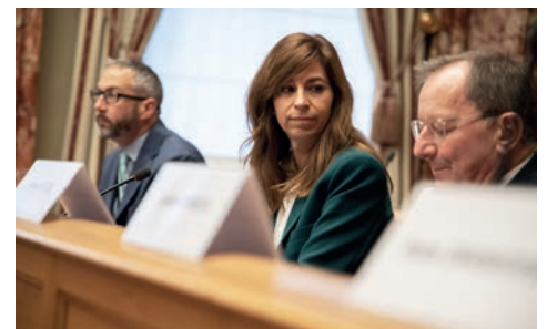
La Représentante de la Commission européenne au Luxembourg, Mme Anne Calteux, à l'occasion de la présentation du programme de travail de la Commission européenne pour l'année 2023

Le renforcement de la position stratégique de l'Europe au niveau international, la gestion des frontières extérieures de l'Union, les vagues de réfugiés ainsi que les questions relatives à la guerre en Ukraine furent d'autres sujets abordés lors de l'échange.